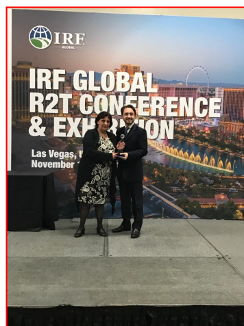
Las Vegas, 2019