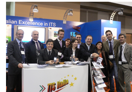
New York, 2008