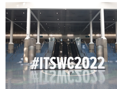
Los Angeles, 2022