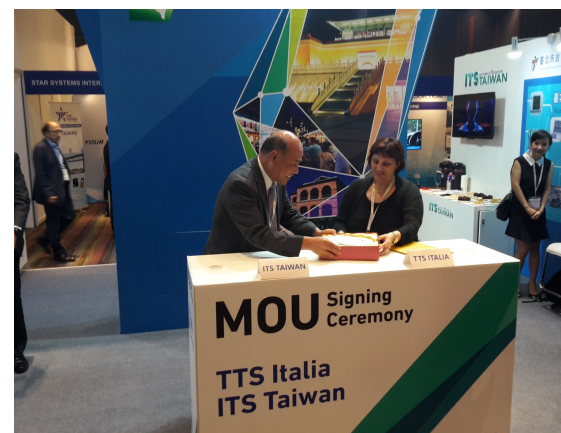
Hong Kong, 2017