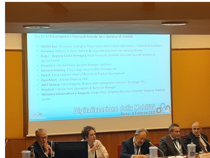
ASSTRA, CLUB ITALIA